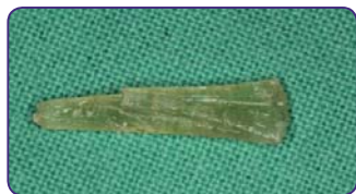
Витягніть індивідуалізований штифт, не полімеризуючи світлом