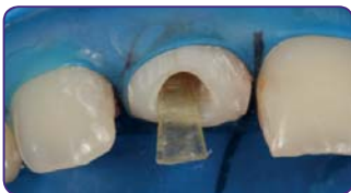
Приміряйте штифт та надайте йому форму в коронковій частині пінцетом