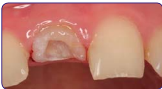
Видалення старої реставрації та препарування