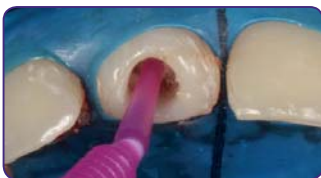
Внесіть Gradia Core Bonding у канал, висушіть та заполімеризуйте світлом