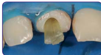
Введіть додаткові штифти, щоб заповнити місце, що залишається, та ущільніть їх латерально