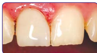
Остаточний вигляд після нанесення шару композиту G-aenial Anterior