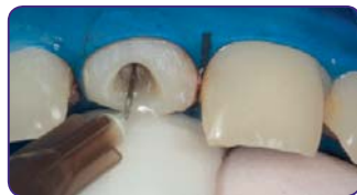
Відпрепаруйте місце для штифта на 2/3 довжини каналу та промийте канал