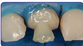
Продовжіть побудову куки