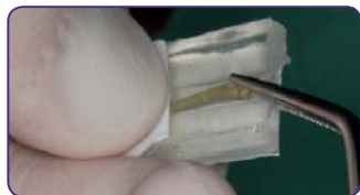
Витягніть штифт з упаковки та відріжте бажану довжину