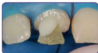
Помістіть штифт та виконайте преполімеризацію («прихватіть світлом»)