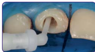
Нанесіть Gradia Core у якості фіксуючого цементу